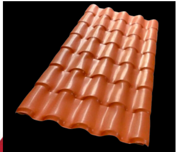
LÁMINA TEJA PVC ONDA GRANDE

Ancho total 1.08 mts. Ancho efectivo .95cm