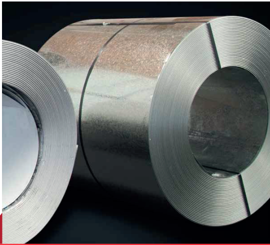
ROLLOS, CINTAS Y ROLLITOS

Es lámina de acero en rollo tipo “bobina”, de los que se parte para diversos procesos como acanalado, nivelado, slitter desvate, etc.