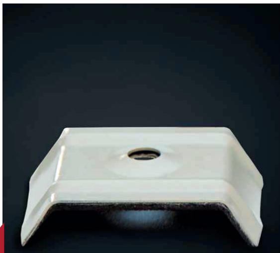
CLIP DE FIJACIÓN P/GALVATECHO

El Clip de Sujeción para Galvatecho , tiene la función de fijación del Galvatecho a la estructura de la construcción donde se pretende instalar. Puede usarse como una arandela en forma rectangular con proporciones adecuadas a la sujeción necesaria del panel.